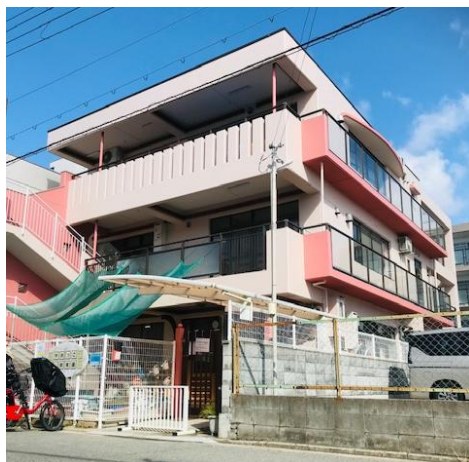
ゆめっこ保育園（本園） 西宮市石在町 16-25