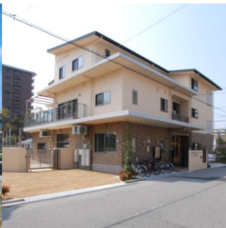
ゆめっこわかば保育園（分園） 西宮市久保町 9-25